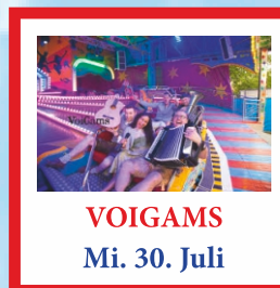
VOIGAMS Mi. 30. Juli