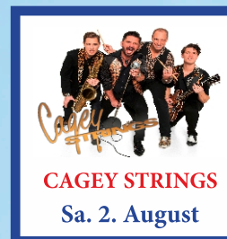
CAGEY STRINGS Sa. 2. August