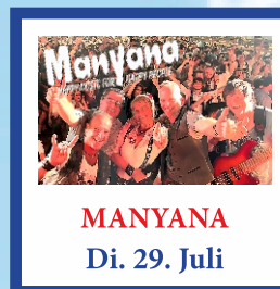
MANYANA Di. 29. Juli