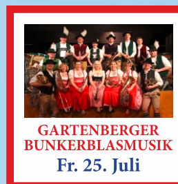
GARTENBERGER BUNKERBLASMUSIK Fr. 25. Juli

Eintritt frei an allen Tagen! Tischreservierung möglich, pro Tisch 20 Wertmarken zu 10,00 €. Wir freuen uns auf Ihren Besuch!