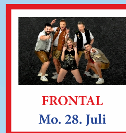
FRONTAL Mo. 28. Juli