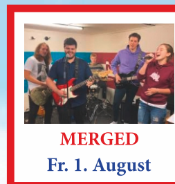
MERGED Fr. 1. August