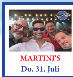
MARTINI'S Do. 31. Juli