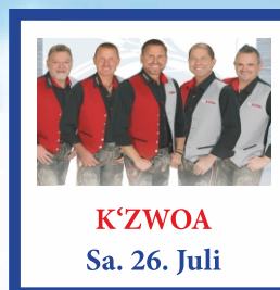
K'ZWOA Sa. 26. Juli