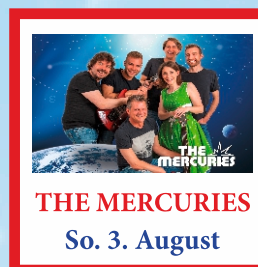
THE MERCURIES So. 3. August

Eintritt frei! Sichern Sie sich die besten Plätze: Reservierungs-Hotline Mail: festbuero.krems@gmail.com